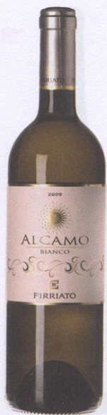
Douwe Walinga, Gastrovino

In het geval van een oersaai feestje, raad ik u het volgende aan. Zet een 'privat' flesje Firriato Bianco Alcamo in de koelkast, en je hebt de avond voor jezelf. 'Never a dull moment' met deze wijn. Levendig sap, smaakvolle peren, maar ook limoen en perzik. Oké dan, één glaasje delen met een aantrekkelijke dame/heer aan de andere kant van de kamer en de avond zit geramd.